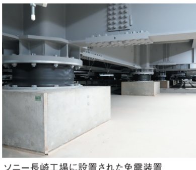
ソニー長崎工場に設置された免震装置

ソニー、免震でBCP刷新 ソニーセミコンダクタマニュファクチャリング(熊本県菊陽町)は、長崎テクノロジーセンターに完成した最新の工場棟に免震構造を採用した。そこには16年4月16日の熊本地震での苦い経験がある。粉砕した鉄骨骨組の基礎、割れた配管、たわんだ鉄骨ブレース。建物の中は壁が崩れ落ち、ウエハーが散乱し、クリーンルームから空が見えた。建屋内に入れたのは震災5日後。「力を合わせて最速復旧」見せる熊本TECの底力」を合言葉に、当時の社長・工場長の陣頭指揮で復旧に取り組んだ。全パートナー企業に絡めても、必要部品や人員リソースは、最速復旧に向けた課題などすべてを共有した。そして5月、ウエハー工程の再開を期し、立ち入り禁止テープをカットした。復旧対策はここで終わらなかつた。復旧経験を業界全体で共有するため情報を公開した。「事業継続計画(BCP)では標準対策だけでは不十分。日本の産業力強化とサプライチェーン強靱(きょうじん)化のためにも実際の被災レベルの大きさを想定した強化策が必要」との思いからだ。建築基準法の観点からも重要視されている。