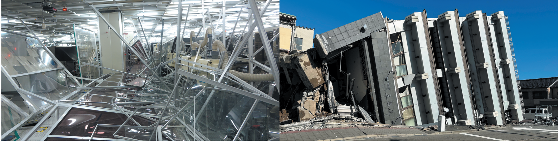
2016年4月16日発生した熊本地震で被災したソニーセミコンダクタマニュファクチャリング熊本テクノロジーセンター半導体工場